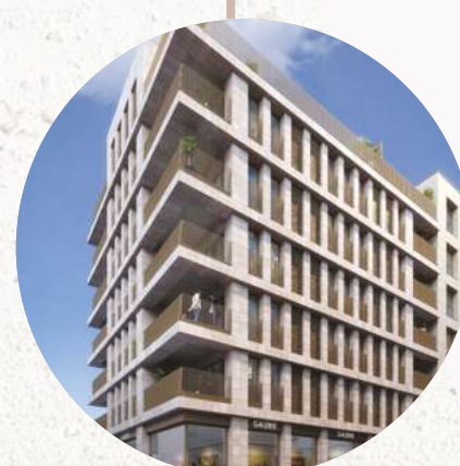
RÉSIDENTE KEPLER 04 DSUD.04