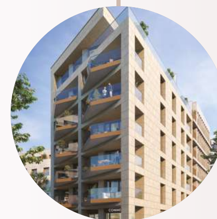
RÉSIDENTE BOHR 05 DSUD.05