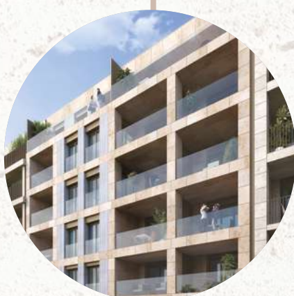
RÉSIDENTE EDISON 02 DSUD.02