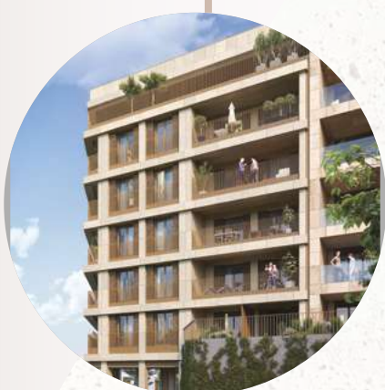
RÉSIDENTE LAVOISIER 01 DSUD.01