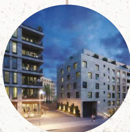
RÉSIDENTE THOMSON 03 DSUD.03