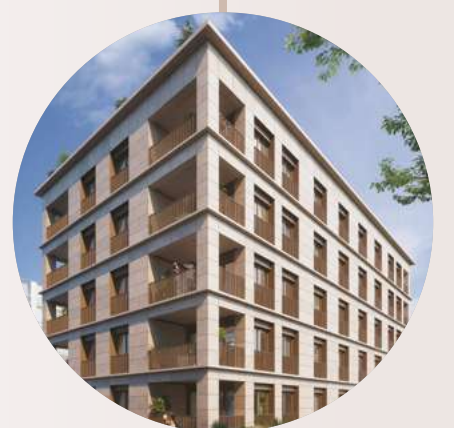
RÉSIDENTE FREYSSINET 06 DSUD.06